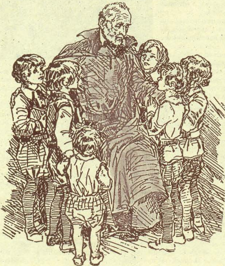
Kalazanci Szent József (1557-1648)