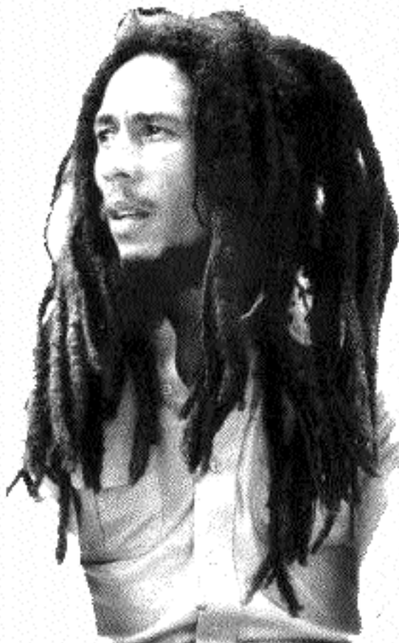
BOB MARLEY 1945-1981