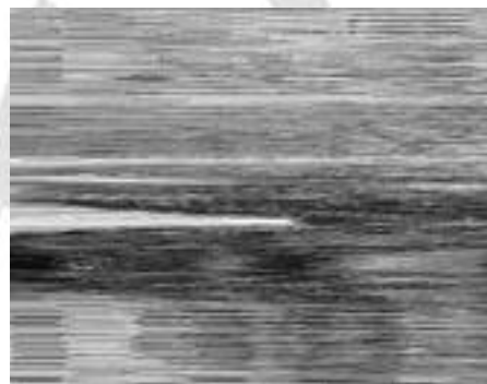
A karolinás testvérosztályok