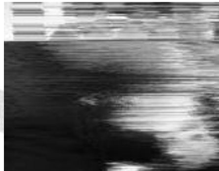
A 12. b osztály szalagtűzője