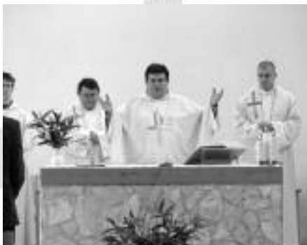
A szalagtűző szentmise