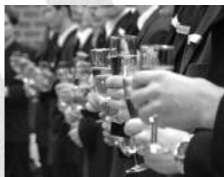
... s ital