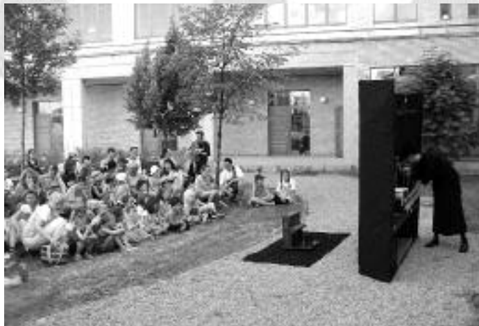
Gyermeknap i bábszínház

Május 21-én Molnár V. József tartotta meg búcsújáró helyek történetét bemutató előadássorozatának befejező részét, az Egri Szervita templom búcsújáról. A Fájdalmas Szűzanyát az özvegyek, az árvák, a gyermeküket, hozzátartozójukat ideje korán elveszített édesanyák, édesapák látogatják, a Szűzanya szenvedéseiből erőt, vigasztalást merítve. Érdekesség, hogy itt a hagyományos, minden katolikus templomban fellelhető keresztút mellett a Szűzanya keresztútja is megtalálható, amely az ő lelkének keresztútját dolgozza fel. Összel Molnár V. Józsefet ismét egy három előadásból álló tematikus