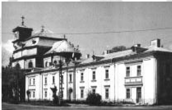
A nagykárolyi piarista templom és rendház