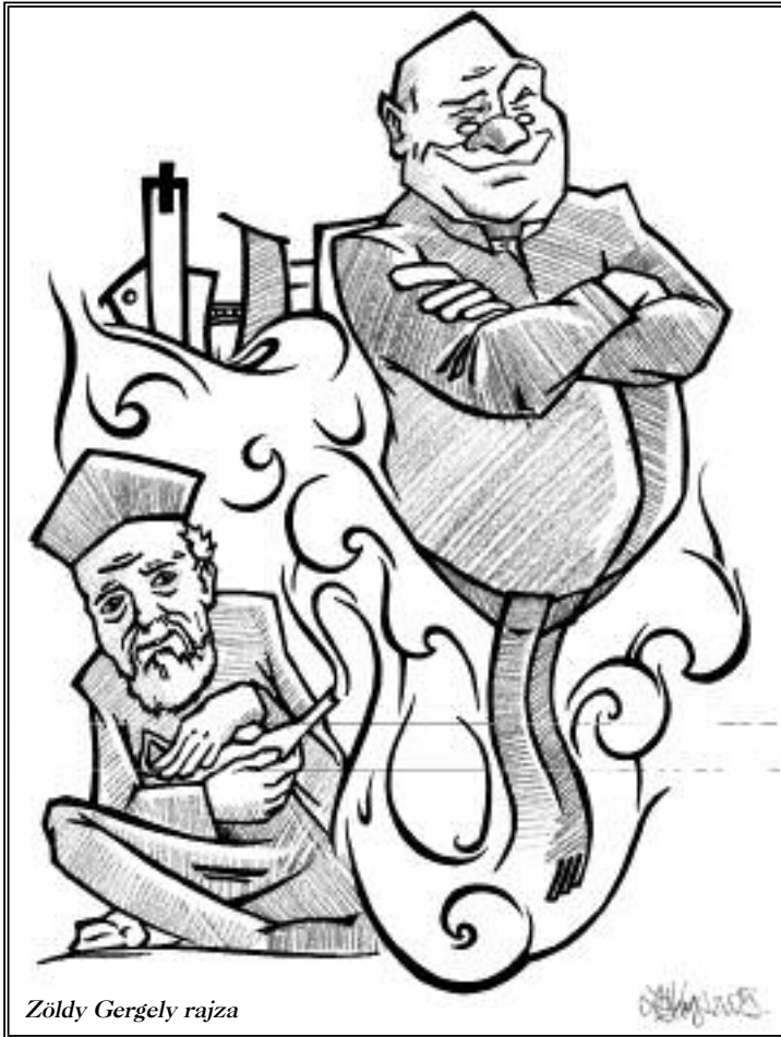
Zöldy Gergely rajza

Az egészséges, egyszerű, mély és gyakorlati hazafiság szelleme, amely nem a szavak hazafisága, nem az újságok