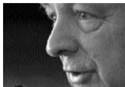
Az aradi szoborcsoport történetét Matekovits Mihálytól hallhattuk október 7-én