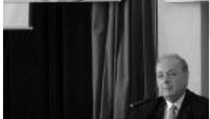
Előadónk az egyik szoborrészlet-installációval