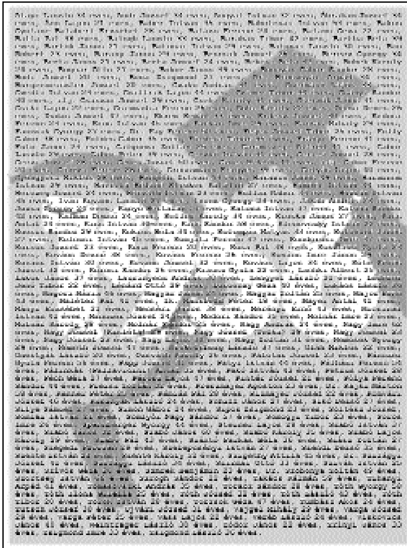
Az 1956-os forradalom és szabadságharcot követően kivégzettek névsora

Nézem, Krisztus, a tévét: ez mind élőhalott: pöszög, dadog,