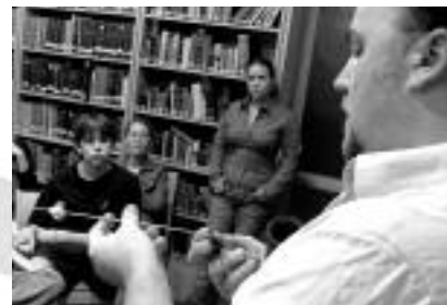
Az előadáson közép-amerikai tárgyakat is megismerhettünk