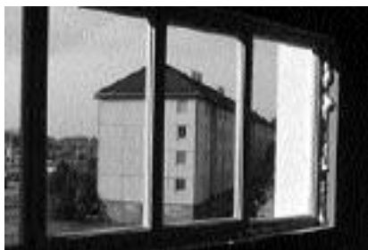
A prenoviciusok elhelyezése érdekében kibővítik a rendházat