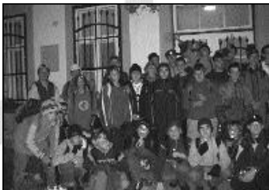
Mártély – vasútállomás Még vidáman

És onnantól kezdetét vette az erőtetett menet... Kissé nehézkes volt újraindulni, ám ekkor még nem is sejtettük, mi