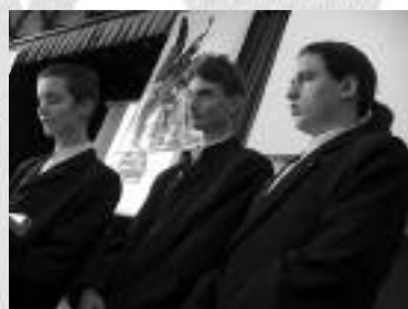
Az aradi vértanúk emlékét diáktársaink idézték fel