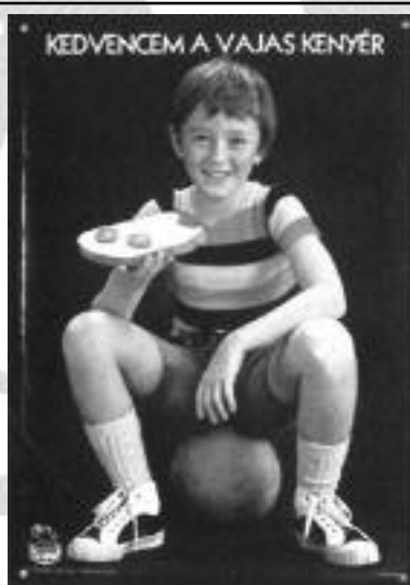
Biztos, hogy a jó oldalát kentem meg?

Ehavi rejtvényünkben Weiner Sennye Tibor gyűrdések című versének egy versszakát rejtettük el. A megfejtéseket 2005. november 13-ig kérjük bedobni szerkesztőségi postaládánkba, vagy elküldeni e-mail címünkre: piarfutar@szepi.hu. Előző rejtvényünk megfejtése négy Karinthy Frigyes négy művének címe: Új génezis, Szerelem, Zsebeim, Naplóm. Könyvjutalmat nyert: Kovács András Gábor szegedi olvasónk.