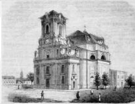
A nagykárolyi Kalazanci Szent József plébániatemplom, mögötte a piarista rendház és iskola

testvériskola növendékei számára. Füzeteket, borítókat, irattartókat, ragasztót, színes papírt, íróeszközöket s a fentebb említettek gyűjtenénk első sorban. De mindent szívesen továbbítunk, ami szükséges lehet egy gyermekotthon működéséhez.