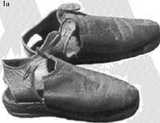
Kalazancius szandálja ma is látható a rend központi házában, Rómában

Még itt vannak, századok csöndjébe és titokzatosságába burkolva, és én meg akarom érinteni őket a kezeimmel, elhalmozni gyengédséggel és simogatni, felemelni őket az ajkaimhoz, lassan megécsokolni, mert ti adtatok, testvéreim, nyugalmat és örömet, Atyám lábainak