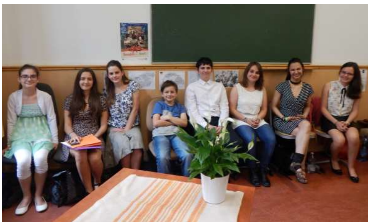
Vizsga pillanatképek az előző, 2016/2017-es tanév végén