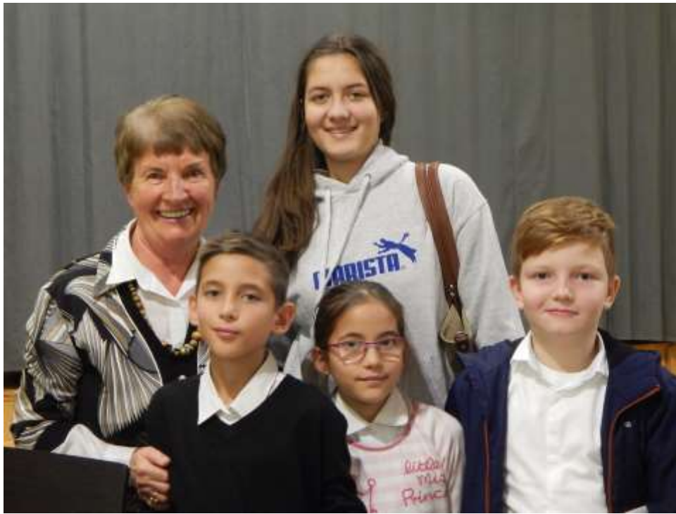
Tanszaki bemutató utáni pillanatkép 2017. decemberében