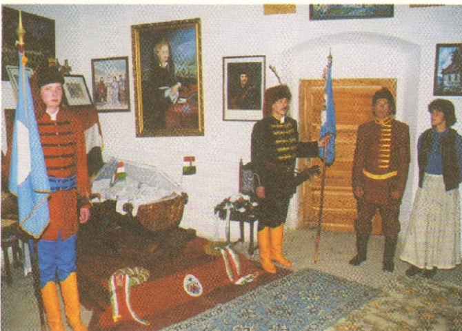
164.4. A borsi kastély egyik szobája ma. A teremben látható emberek Rákóczi-kori ruhákat viselnek