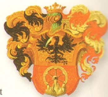
164.2. Rákóczi címere