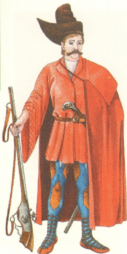
162.1. Kuruc gyalogos, az úgynevezett talpas. Hasonlítsd össze a 124. oldalon található francia katonával (az osztrákok felszerelése ahhoz nagyon hasonló volt)!