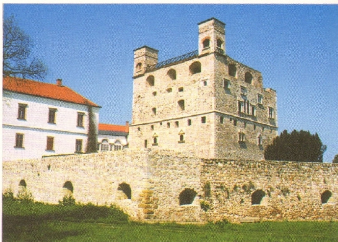
164.5. A fejedelem gyakran tartózkodott a sárospataki várban. 1708-ban országgyűlést is tartottak itt

A vár feladása után a 12 esztendős Ferencet Bécsbe vitték. Habsburg-hű emberré akarták nevelni. Soha többé nem találkozhatott az édesanyjával.