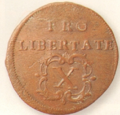
163.2. Rákóczi által veretett rézpénz, az ún. libertás. Latin feliratának jelentése: a szabadságért. A szabadságharc végére teljesen elértéktelenedett

A szatmári béke biztosította a rendi jogokat a magyar nemesség számára. Így megmaradt Magyarország különállása, nem lett a Habsburg Birodalom egyik tartománya.