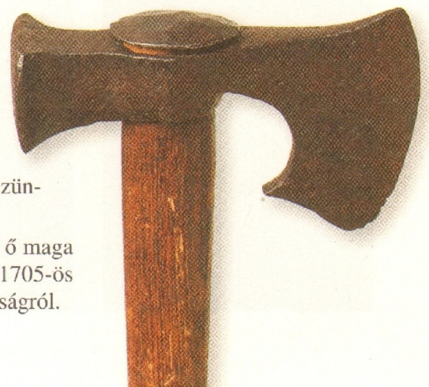
161.3. A kurucok kedvelt fegyvere volt a fokos

Igyekezett békésen orvosolni a protestánsok sérelmeit, bár ő maga hívő katolikus volt. A szabad vallásgyakorlat szellemében az 1705-ös szécsényi országgyűlésen törvényt hoztak a lelkiismereti szabadságról.