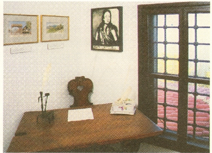
165.2. A fejedelem dolgozószobája Rodostóban

Középiskoláit – kiváló eredménnyel – egy jezsuita rendházban végezte. Ezután Csehországba, a prágai egyetemre küldték tanulni.