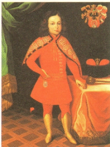
164.1. II. Rákóczi Ferenc nyolcéves korában