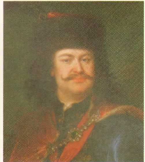
161.1. II. Rákóczi Ferenc a felkelés kirobbanásakor Lengyelországban bujdosott, miután megszökött a Habsburg császár börtönéből