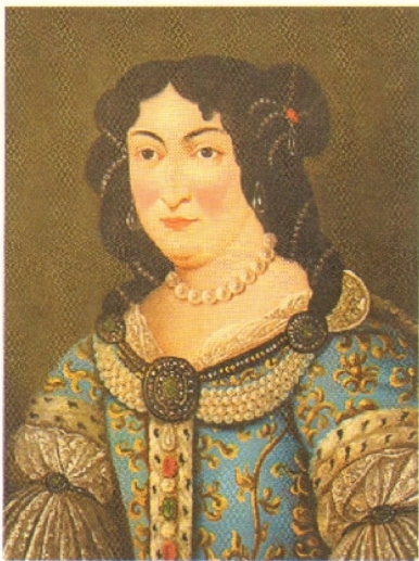
164.3. A fejedelem édesanyja, Zrínyi Ilona – „Európa legbátrabb asszonya”