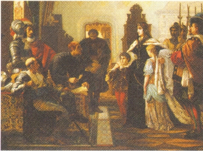
165.1. Zrínyi Ilona a vizsgálóbírái előtt (19. századi festmény)