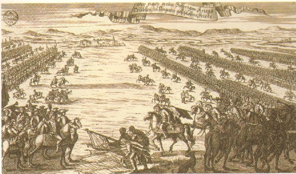
163.1. A kuruc seregek a békeszerződés aláírása után Szatmár közelében, a majtényi síkon letették a fegyvert