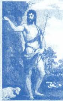
Tiziano: Keresztelő Szent János