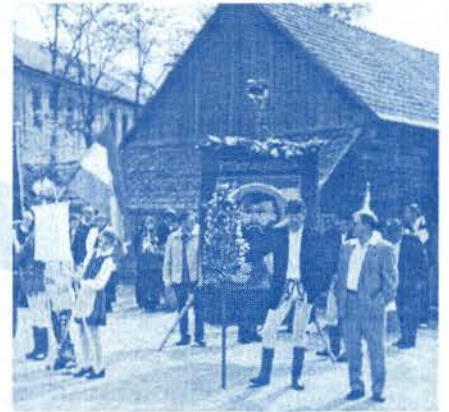
A csíkpálfalvi keresztalja

Jártunk a csíkpálfalvi általános iskolában, ahol az igazgatónő körbevezetett minket. Kialakítottak egy számítógép-