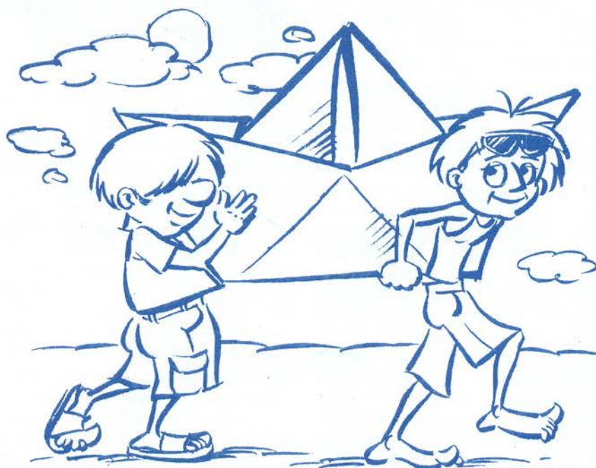
Márok Attila rajza