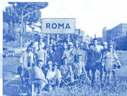
Még a biciklit is Rómába vezet...

Az Örök Városban töltött első napon megnéztük a Vatikáni Múzeumot és a Szent Péter bazilikát . Amíg a múzeumba való bebocsátásra várakoztunk, közben az esőben való nyilvános énekléssel tettünk szert némi zsebpénzre. Sok arra járó magyar meglepődve tapasztalta, hogy a „ Kossuth Lajos azt üzenté... ” Olaszországban is nagy népszerűségnek örvend. A második napon a Colosseumot és a Forum Romanumot jártuk be. Az ezt követő napokban Róma legnagyobb bazilikáit és a leghíresebb műemlékeket jártuk végig ( Santa Maria Maggiore, Santa Maria sopra Minerva, Santa Maria degli Angeli, Santa Maria Crucé, San Giovanni in Laterano, San Paolo, San Pietro in Vincolo, Pantheon, Spagna, Piazza Navona, Fontana di Trevi, Capitoliumi Múzeum, II. Viktor Emmanuél emlékműve, Magyarok kápolnája ). A Szent Péter bazilika altemplomában, a Magyarok kápolnájában tartott misén is volt