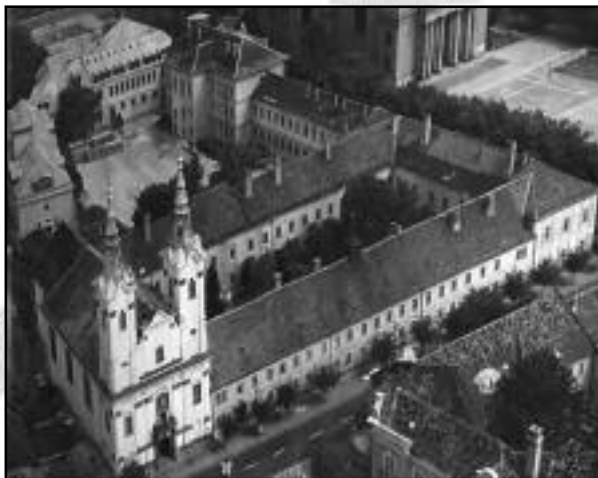
A váci piaristák birodalma: templom-rendház-iskola. Itt működik a novíciátus.

Ezalatt az idő alatt a világtól majdnem teljes elzártágban élve, kivonulva a mai világ forgatagából, figyelmünket a nyugalom és a csend légkörében teljesen erre tudjuk fordítani. Ugyanakkor teljesen egyértelmű, hogy a világtól való elszakadás és a külső emberi kapcsolatok lecsökkentése cseppet sem könnyű. Itt nincs televízió, nincsen rádió, sem pedig mobiltelefon. A novícius havonta mindössze egy dél-