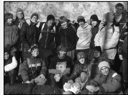
Suba-lyuk: az ősember nyomában

Második túranapunkon következett az előző napi 15 kilométeres "bemelegítés" után a Nagy Menet (NM): egy oda-vissza jó harmincas túrával a Bükk-fennsík szélén fekvő Három-kőig, majd haza. A nem csekély távolságon felül még kb. 400 méter szintet is le kellett küzdenünk, felkapaszkodandó a Bükk-fennsík mészkő platójára. De mögcsináltuk! Reggel nyolckor indultunk, és fél kettőkor már a Három-kő kissé huzatos csúcsán majszoltuk tikkadtan fagyott ebédünket. És vígan indultunk hazafelé: mi ez nekünk! De azért gondoskodtunk izgalomról is, nehogy már minden ilyen simán menjen: a hazafelé tartó út felénél ugyanis lehetőség volt ketté válnia a csapatnak, egy 3-4 kilométernyi útszakaszra. Az egyik csoport azon a jelzett ösvényen haladt, amelyen odafelé is mentünk, a másik csapat egy hosszabban kanyargó, de végig egyértelmű, behavazott betonúton ért (volna) egy már az odaútról ismert közös találkozási ponthoz. Persze: mi az hogy „egyértelmű”? Mit jelent az, hogy az összesen két betonutas elágazás közül az elsőnél jobbra, a másodiknál balra kell(ett volna) menniük? Szóval már sejtí a kedves olvasó: a betonutasok elkavartak egy kissé. Talán úgy gondolták, hogy a harminc kilométer nem elég nekik, és vagányul rá kell tenniük még hetet-nyolcat? Lehet. Rátették. Megcsinálták. Kibírták. (Az én