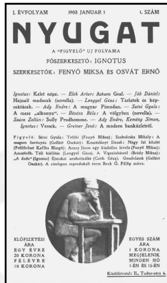
Az első szám

A lap történetében négy nagyobb stádiumot lehet elhatárolni. Az első a háború előtti tartott, a második a tanácsköz-