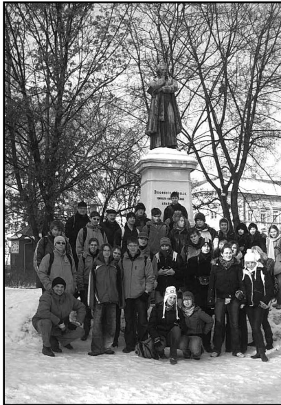
Németországi vendégeink Dugonicsnál