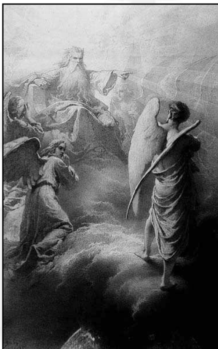
A híres Madách-illusztrációk egyike

Bár képeit el tudta adni, és megrendeléseket is kapott, mindez nem volt elég, hogy egzisztenciáját megalapozza.