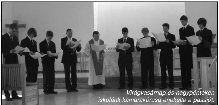
Virágvasárnap és nagypénteken iskolánk kamarakórusa énekelte a passiót.