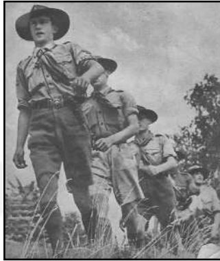
Fiúk, fel a fejjell!

Egy évben általában három kirándulás van, ősszel és