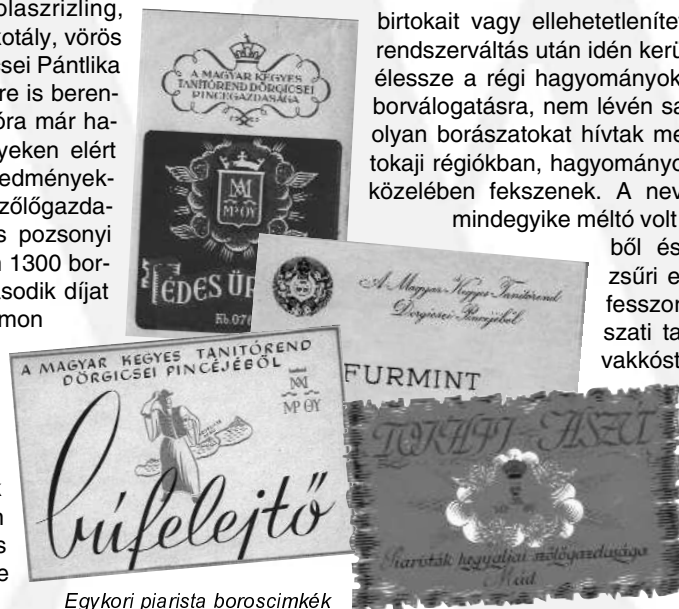
Egykori piarista boroscímkék

A Piarista Bor megrendelhető a Piarista Ajándékboltban: www.bolt.piarista.hu