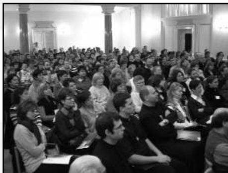
A szegedi tantesztület jobbra fent

ányt szenvedtek vagy szenvednek. A szülői figyelem stílusbeli különbségei mindig is érezhetőek voltak, ma viszont már nem pusztán árnyalatnyi eltéréseket látunk, hanem már-már jóvátehetetlennek tűnő sérülések nyomait és következményeit. Régebben lehetett azt mondani, hogy az efféle sérülésekkel forduljanak másokhoz, mi nem vagyunk az ilyen „jellegű” gyermek segítségével szakemberek. Manapság azonban mindnyájan azt érezzük, hogy nem intézhetjük el így a dolgot. Az új helyzet új választ