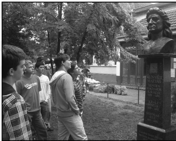
Hű, de király...!