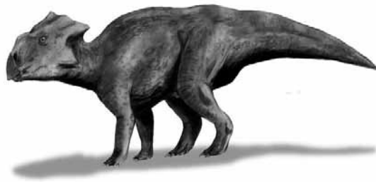
Egy másik magyar dínó: az Ajkaceratops