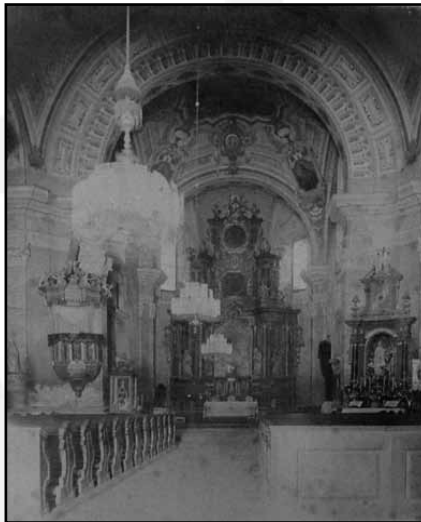
A palánki templom belseje: a mai Dóm helyén állt a Szent Dömötör plébániatemplom, ahol a piaristák gyakor miséztek