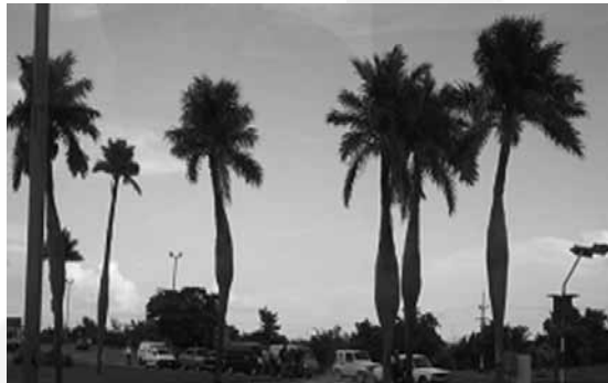
Mint jóllakott anakondák, úgy sorakoznak a palacktörzsű pálmák

A fásszárú növények között van néhány csoport, melynek tagjait még a növénytanban legjáratlanabb is könnyedén fölismeri. Ki ne tudná, milyen egy fenyő, egy fűzfa vagy éppen egy pálma? A pálmákat pedig nemcsak közismertek, hanem igen kedveltek, mondhatjuk csodáltak is. Sudár, elágazás nélküli, oszlop alakú, olykor igen magas törzsük (akár 60 m!), hatalmas, zöld levélkoronájuk, látványos virágzataik valóban lenyűgözőek.