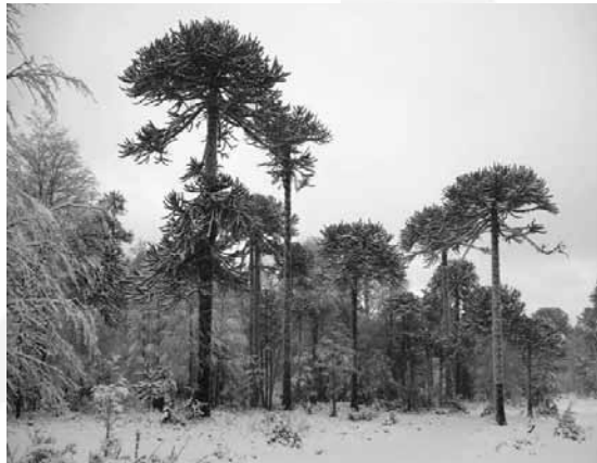
Ugyan az északi tajga a világ legnagyobb fenyvese, a déli félgömbön is találunk fenyőerdőket. A képen a dél-amerikai Andok hegység különleges formájú fenyői, az araukariák láthatók.

A leghidegebb, leghidegebb, legszárabb tajga fenyőinek még a legkifinomultabb vízvisszatartó eszközök sem elegendők. A vörösfenyő – mely hazánkban is elő-előfordul – a téli száraz hidegben egyáltalán nem kockáztathatja, hogy elveszítse a nedvességet, úgyhogy inkább ősszel elhullajtja tűleveleit, és a teljes inaktivitás állapotába kerül, s majd tavasszal, a hideg és a szárazság enyhültével új tűleveleket hajt. Ha tehát télen megkopaszodott fenyőt látunk, ne gondoljuk, hogy elpusztult: