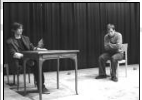
Színpadon a tizediká

A z idei Humorfesztivál február 27-én került megrendezésre iskolánkban. Sok igényes, s néhány kevésbé nívós darab került színpadra. Sajnos idén sem láthattunk zenes mősorszámokat. Első helyezést a 10. A osztály Monty Python -számokból álló abszurd produkciója ért el (tavaly is ők nyerték a rangos trófeát). Második a 11. B Fedőneve: gimnázium című film-produkciója, harmadik a színpadi szereplésben újoncnak számító 7. A osztály műsora lett.