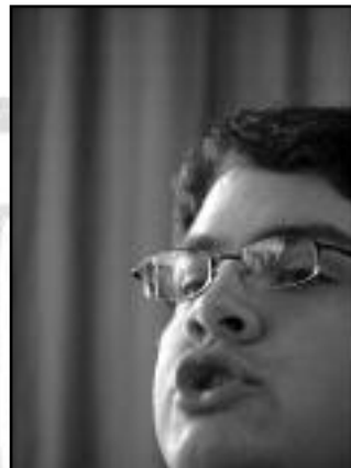
Elindultam szép hazámból...